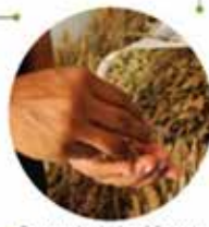
• Se recolecta la chíá y se deja secar de forma natural