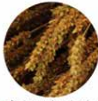
• Se desprende cada vaina y se talla con los dedos