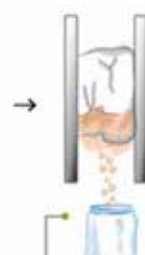
• Prensado manual. Una vez envuelta la masa en la tela se toma con las manos y se presiona para extraer el aceite de chíá.