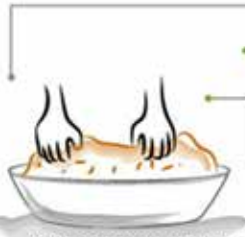
Ahora debe amasarse hasta que sea evidente el aceite en las manos.