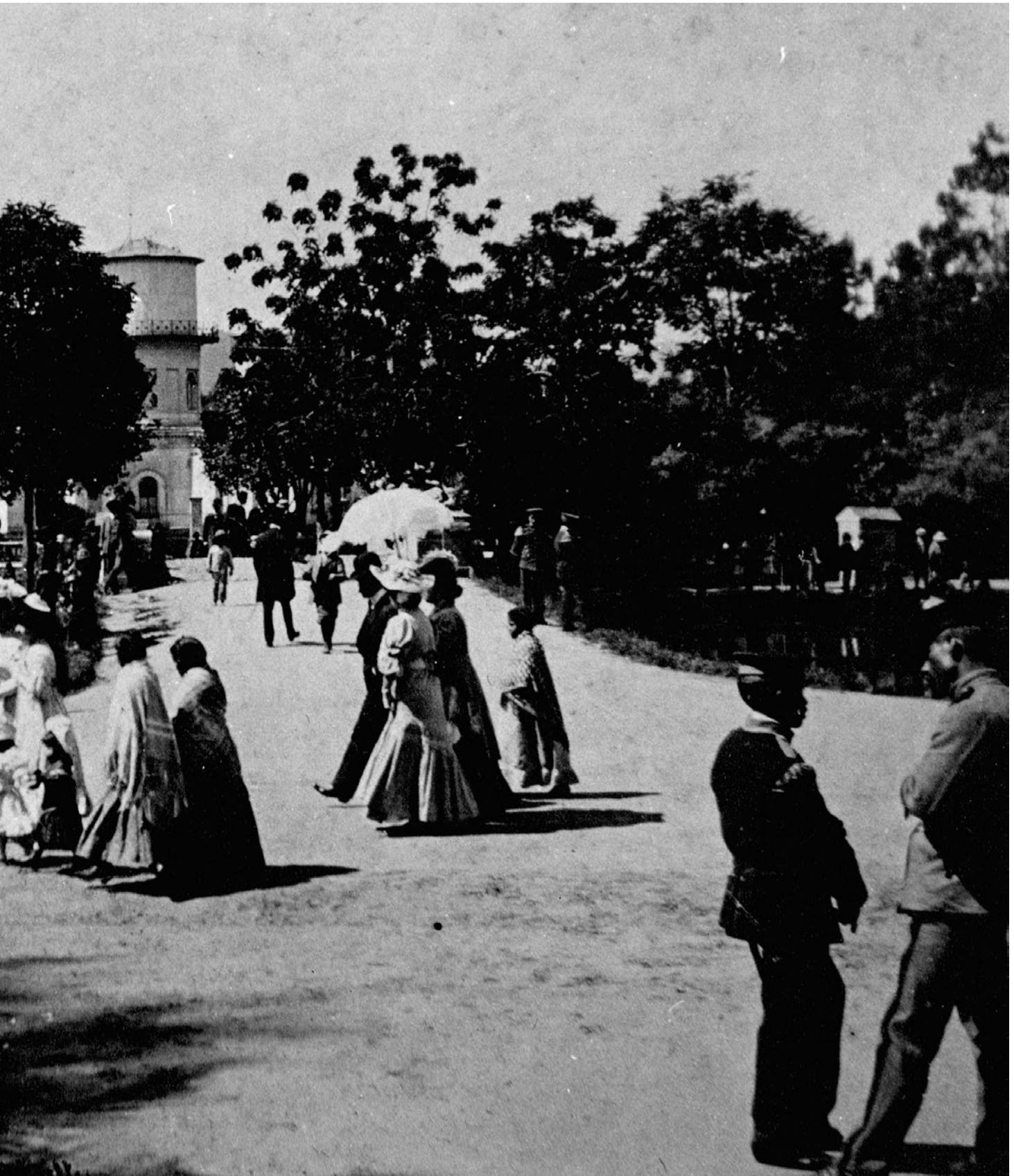
FIGURA 1. Paseantes en La Alameda, c. 1900.