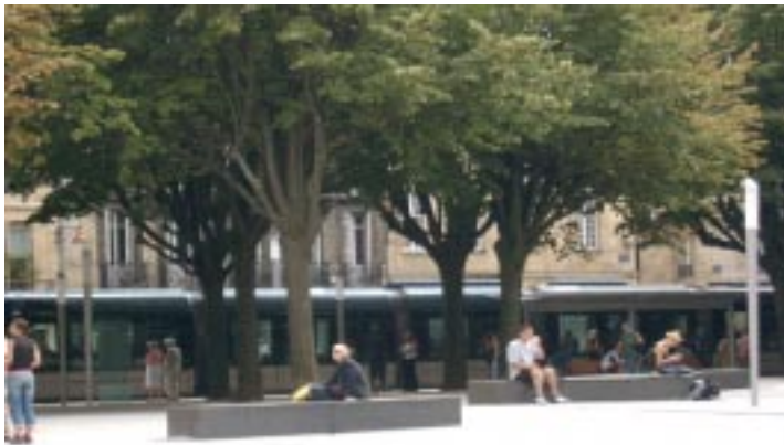
Burdeos 2004. El nuevo tren-tranvía urbano es el argumento central de la regeneración urbana.