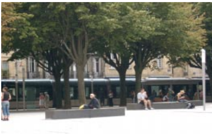
Burdeos 2004. El nuevo tren-tranvía urbano es el argumento central de la regeneración urbana.