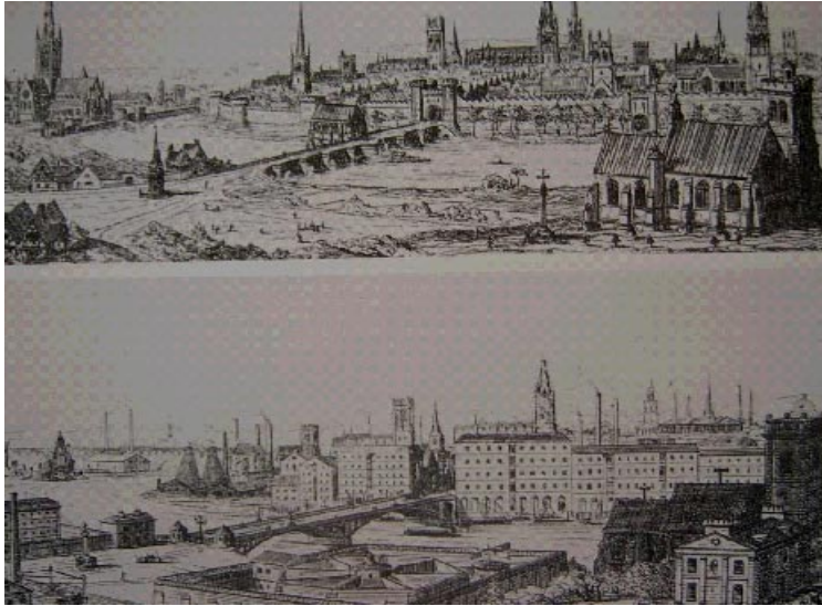
A.W. N.Pugin, 1841, Resistencia a las transformaciones en la ciudad industrial: La ciudad ideal es la del pasado.