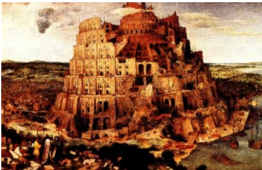
La Torre de Babel , Pieter Bruegel, 1563.

Casi todos aspiramos a vivir en un entorno excepcional.