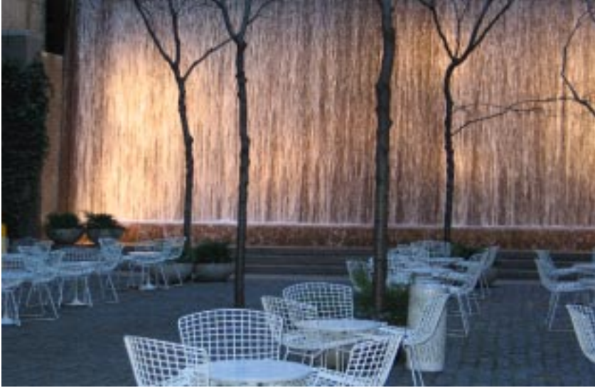
Paley Park, pequeño espacio urbano en Nueva York.