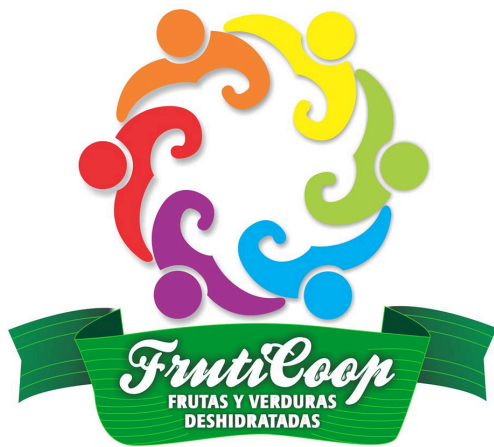
Figura 5: Logo de la empresa.

Para su imagen se tiene la proyección de elaborar un diseño nuevo y más atractivo, los productos llevan plasmada la marca del producto la cual es Fruticoop el nombre de la misma empresa.