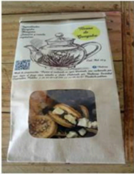
Tisana de guayaba 65 gr.