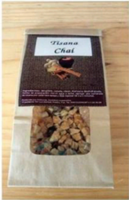
Tisana de chii 65 gr.