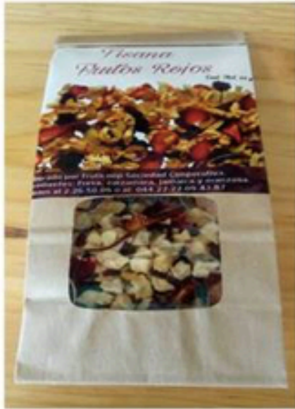
Tisana de frutos rojos 65 gr.