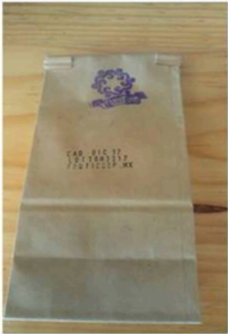
Imagen trasera de cada tisana.