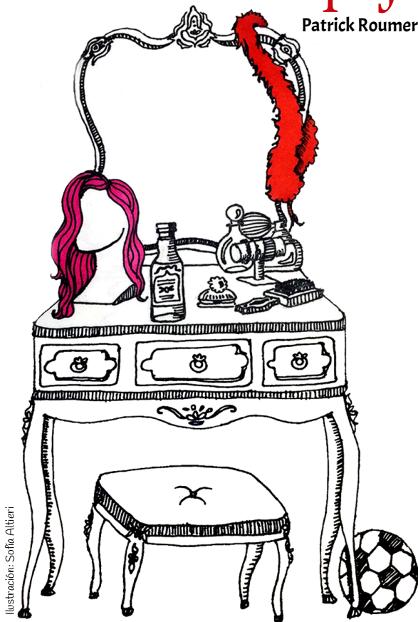
Ilustración: Sofía Altieri