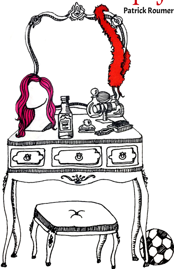
Ilustración: Sofía Altieri