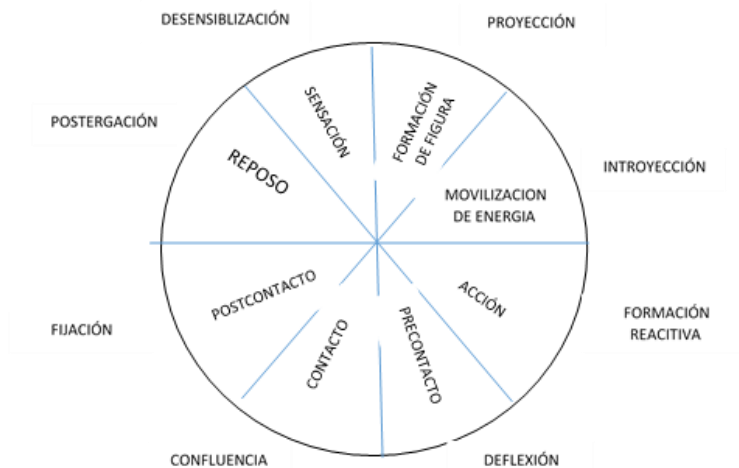
Fig. 1 Etapas del ciclo de la experiencia

En la Gestalt, para trabajar con las polaridades, bloqueos y conductas inadecuadas, se utilizan los experimentos que comprenden técnicas concretas para lograr que la persona pueda desarrollar conductas nuevas a través de la creatividad y alinearlas a una nueva concepción de sí mismo.