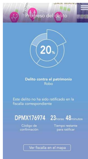
Pantalla de proceso de denuncia de prototipo de alta fidelidad

Este prototipo se hizo utilizando la herramienta JustInMind Prototyper, que proporciona herramientas para que el usuario