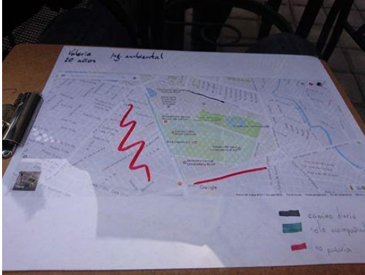
Fotografía de material de la actividad con mapas

Se entrevistaron a alumnos de la Benemérita Universidad Autónoma de Puebla (BUAP), para conocer su punto de vista respecto a la seguridad de la zona por la que transitan cotidianamente. Para ello se ocupó un mapa impreso de Ciudad Universitaria (CU) y colonias aledañas, acetatos para que los usuarios marcaran las zonas que transitan o que consideran peligrosas y un micrófono para grabar los diálogos.