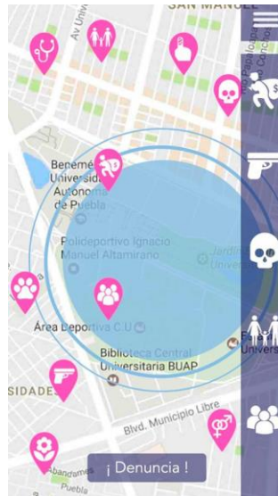
Pantalla de página principal de prototipo de alta fidelidad