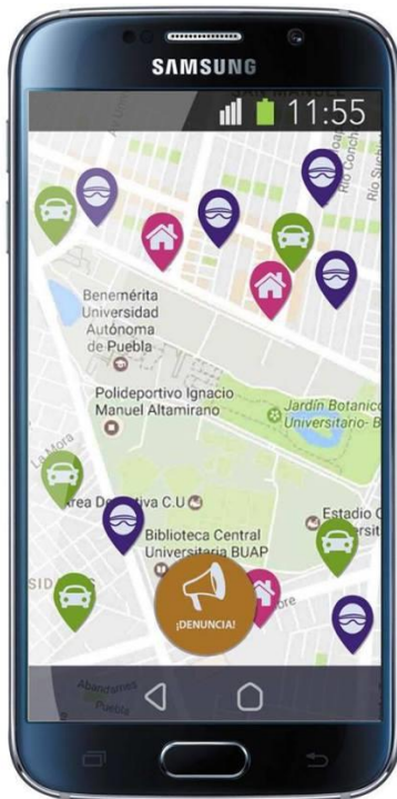
Pantalla de página principal de prototipo de fidelidad media

En esta versión, el usuario comprendió cómo iniciar el proceso de denuncia, sin embargo, no lo entendió como un proceso que va más allá de presionar el botón para denunciar. Logró conocer que existía la posibilidad de interactuar con otros, pero el resto de los objetivos no se cumplieron por tres factores importantes. El primero fue el estilo visual, que no era armónico y se sentía pesado. El segundo estuvo logado a cuestiones semióticas, porque los íconos no representaban lo que se pretendía para el usuario. El tercero fue la arquitectura de información, que no estaba estructurada para que los usuarios entendieran las tareas como procesos.