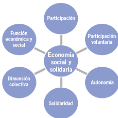
Figura 1.2. “Principios operativos comunes de las organizaciones y empresas de Economía Social y Solidaria”.

Es por esto que para la OIT las empresas de la Economía Social y Solidaria se convierten en una alternativa como modelo empresarial que permiten la reinserción de los grupos vulnerables en la vida laboral y además, abarcan las cuatro dimensiones del objetivo general de la creación de trabajo decente, que son, el empleo productivo, la protección social, el respeto a los derechos y a la voz, tal como se representa en la Figura 1.2.