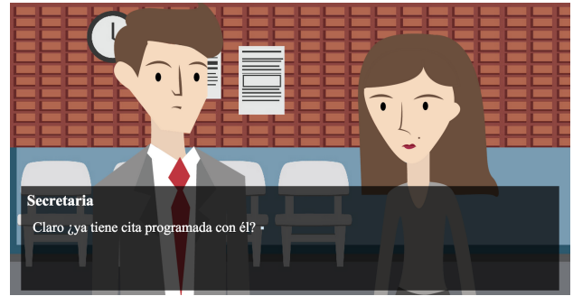
Figura 4: Pantalla de prototipo de media fidelidad.

Buscamos que se viera estético y simple para que el jugador pudiera concentrarse más en el contenido de los textos, pero sin perder detalles de los gráficos.