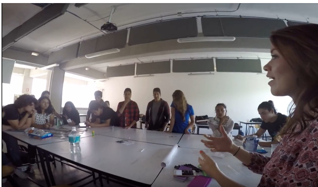
Figura 1: Workshop anticorrupción.

Posteriormente realizamos un workshop en la Universidad Iberoamericana de Puebla, para conocer su forma de pensar y comprender mejor las razones por las cuales los jóvenes sucumben ante una situación de corrupción, así como también conocer la opinión de los jóvenes sobre cómo se podría solucionar la problemática.