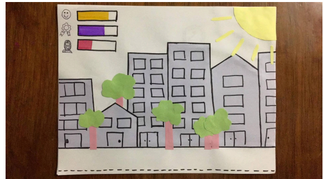
Figura 2: Escenario de prototipo en papel.

El primer prototipo realizado se hizo en hojas de papel tamaño carta, con recortes de hojas de colores, plumones y lápices de color.