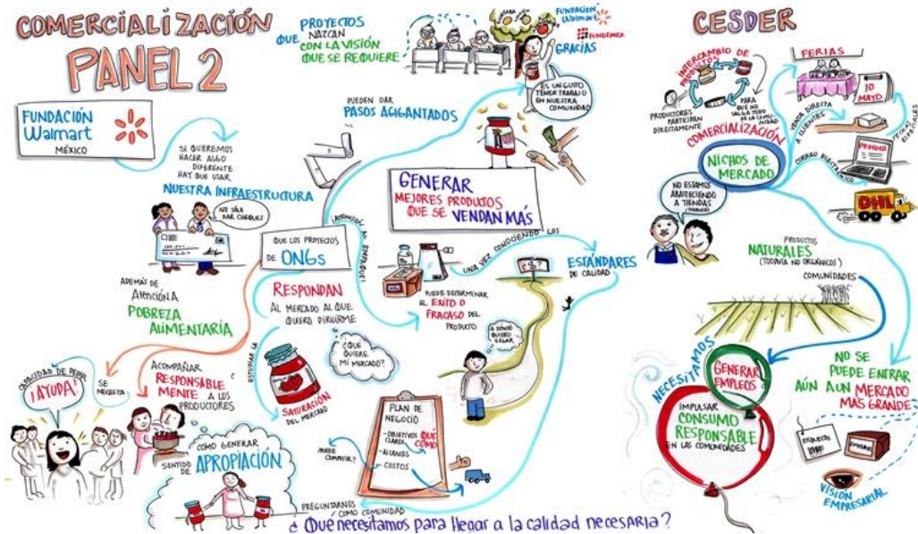
Figura 3 Conclusiones Foro de Intercambio de Experiencias OSC y GDB