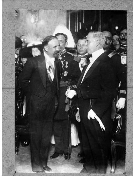
9) Francisco León de la Barra entrega el poder a Francisco I. Madero en Palacio Nacional, repografía , Núm. de inventario 33497, Archivo Casasola, Fototeca Nacional del INAH. Imagen tomada del sitio de la Fototeca Nacional del INAH: http://www.fototeca.inah.gob.mx/fototeca/ (Fecha de actualización: 24 de noviembre de 2015)