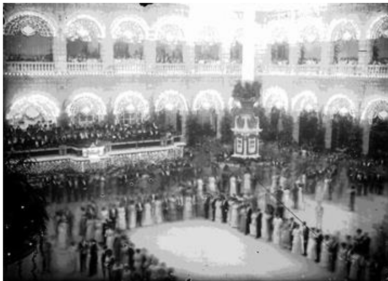
6) Gente durante el baile ofrecido en Palacio Nacional, durante los festejos del Centenario de la Independencia , Núm. de inventario 33626, Archivo Casasola, Fototeca Nacional del INAH. Imagen tomada del sitio de la Fototeca Nacional del INAH: http://www.fototeca.inah.gob.mx/fototeca/ (Fecha de actualización: 24 de noviembre de 2015)