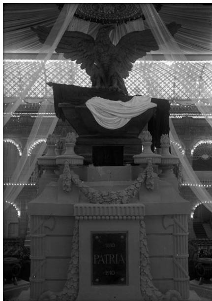
8) Catafalco conmemorativo a los Héroes de la Independencia, levantado en el patio central de Palacio Nacional , Núm. de inventario 5252, Archivo Casasola, Fototeca Nacional del INAH. Imagen tomada del sitio de la Fototeca Nacional del INAH: http://www.fototeca.inah.gob.mx/fototeca/ (Fecha de actualización: 24 de noviembre de 2015)