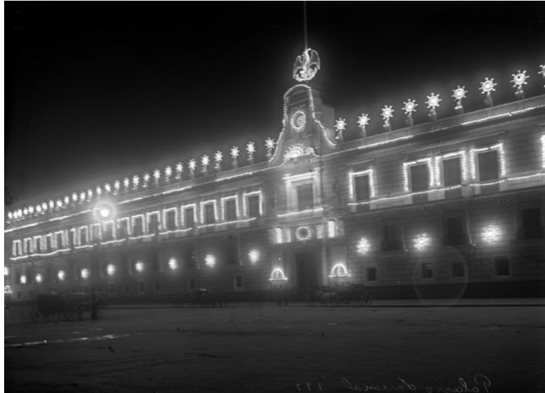
5) Palacio Nacional, con iluminación , Núm. de inventario 88607, Archivo Casasola, Fototeca Nacional del INAH. Imagen tomada del sitio de la Fototeca Nacional del INAH: http://www.fototeca.inah.gob.mx/fototeca/ (Fecha de actualización: 24 de noviembre de 2015)