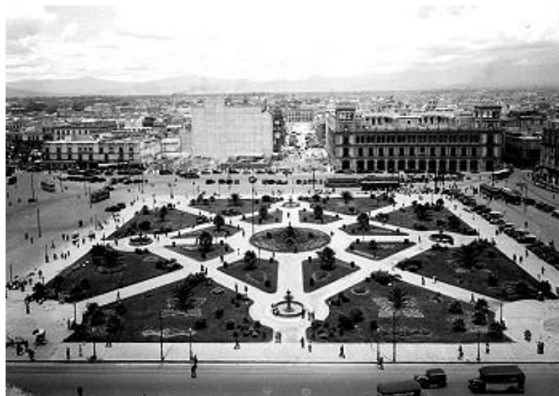
17) Plaza del Zócalo, vista panorámica desde el Palacio Nacional , Núm. de inventario 201486, Archivo Casasola, Fototeca Nacional del INAH. Imagen tomada del sitio de la Fototeca Nacional del INAH: http://www.fototeca.inah.gob.mx/fototeca/ (Fecha de actualización: 24 de noviembre de 2015)