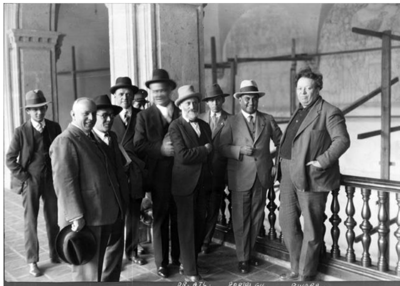
16) Emilio Portes Gil, Diego Rivera y otras personalidades en pasillos de Palacio Nacional , Núm. de inventario 5860, Archivo Casasola, Fototeca Nacional del INAH. Imagen tomada del sitio de la Fototeca Nacional del INAH: http://www.fototeca.inah.gob.mx/fototeca/ (Fecha de actualización: 24 de noviembre de 2015)