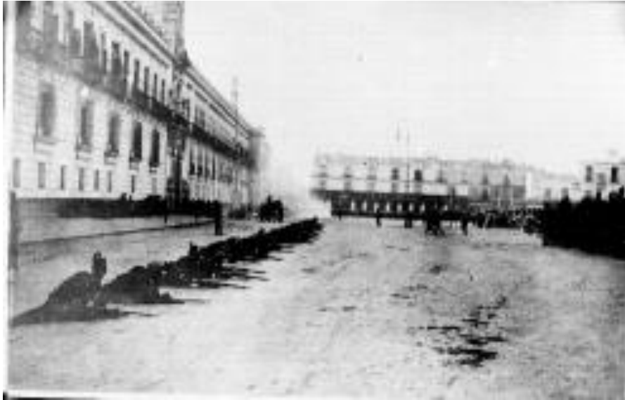
11) Ejército Federal tendido pecho a tierra antes de la llegada del general Bernardo Reyes a Palacio Nacional , Núm. de inventario 37187, Archivo Casasola, Fototeca Nacional del INAH. Imagen tomada del sitio de la Fototeca Nacional del INAH: http://www.fototeca.inah.gob.mx/fototeca/ (Fecha de actualización: 24 de noviembre de 2015)