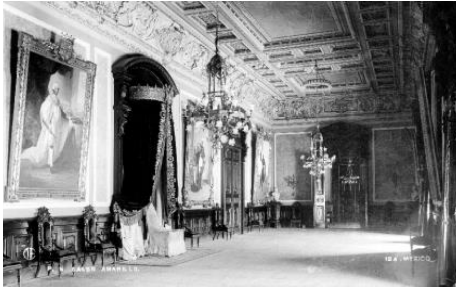
7) Salón Amarillo de Palacio Nacional , Núm. de inventario 121187, Fondo C.B. Waite/ W. Scott, Fototeca Nacional del INAH. Imagen tomada del sitio de la Fototeca Nacional del INAH: http://www.fototeca.inah.gob.mx/fototeca/ (Fecha de actualización: 24 de noviembre de 2015)