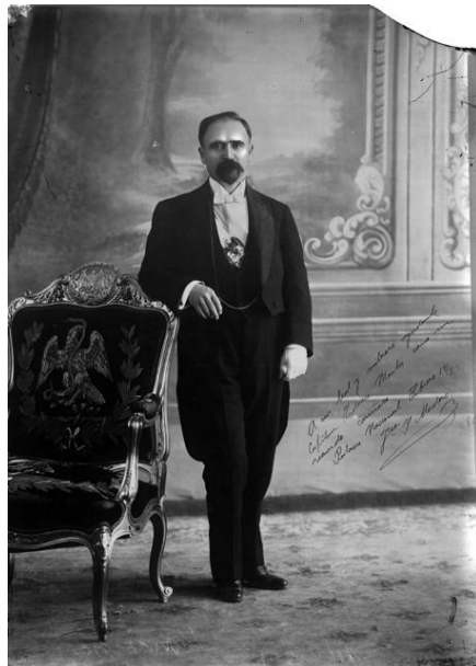
10) Francisco I. Madero, retrato , Núm. de inventario 36484, Archivo Casasola, Fototeca Nacional del INAH. Imagen tomada del sitio de la Fototeca Nacional del INAH: http://www.fototeca.inah.gob.mx/fototeca/ (Fecha de actualización: 24 de noviembre de 2015)