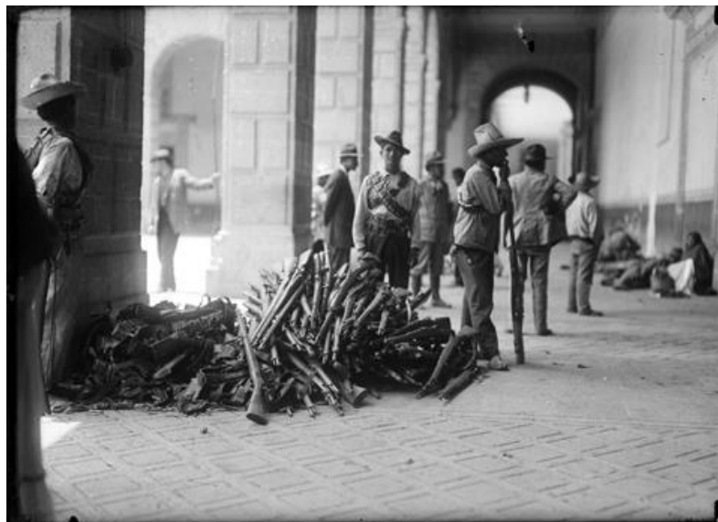
14) Soldado Yaqui realiza guardia junto a unas armas en los patios de Palacio Nacional , Núm. de inventario 38893, Archivo Casasola, Fototeca Nacional del INAH. Imagen tomada del sitio de la Fototeca Nacional del INAH: http://www.fototeca.inah.gob.mx/fototeca/ (Fecha de actualización: 24 de noviembre de 2015)