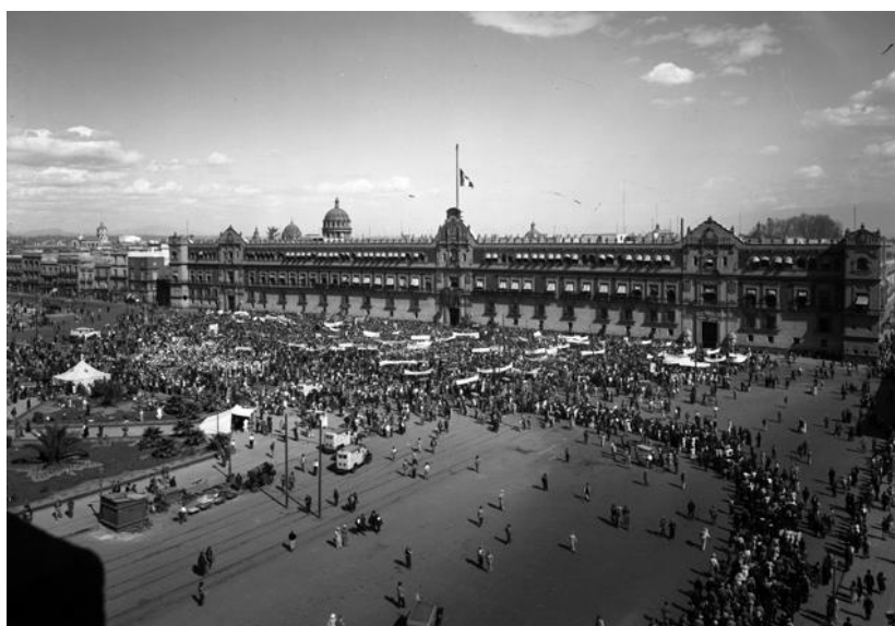
18) Manifestación obrera frente a Palacio Nacional , Núm. de inventario 4845, Archivo Casasola, Fototeca Nacional del INAH. Imagen tomada del sitio de la Fototeca Nacional del INAH: http://www.fototeca.inah.gob.mx/fototeca/ (Fecha de actualización: 24 de noviembre de 2015)