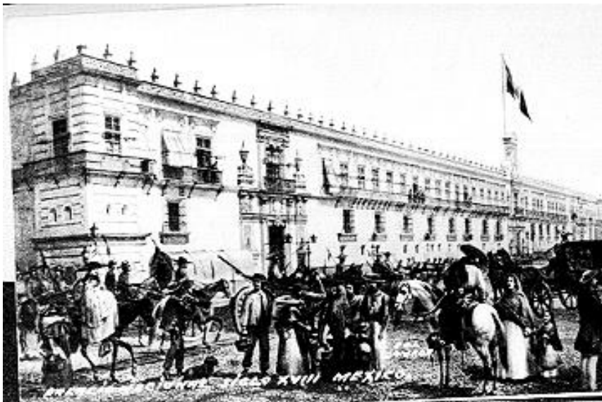
2) Palacio Nacional, litografía , Núm. de inventario 201482, Archivo Casasola, Fototeca Nacional del INAH. Imagen tomada del sitio de la Fototeca Nacional del INAH: http://www.fototeca.inah.gob.mx/fototeca/ (Fecha de actualización: 24 de noviembre de 2015)