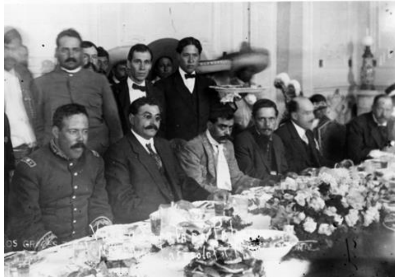
13) Villa y Zapata durante un banquete ofrecido por Eulalio Gutiérrez en Palacio Nacional , Núm. de inventario 63467, Archivo Casasola, Fototeca Nacional del INAH. Imagen tomada del sitio de la Fototeca Nacional del INAH: http://www.fototeca.inah.gob.mx/fototeca/ (Fecha de actualización: 24 de noviembre de 2015)