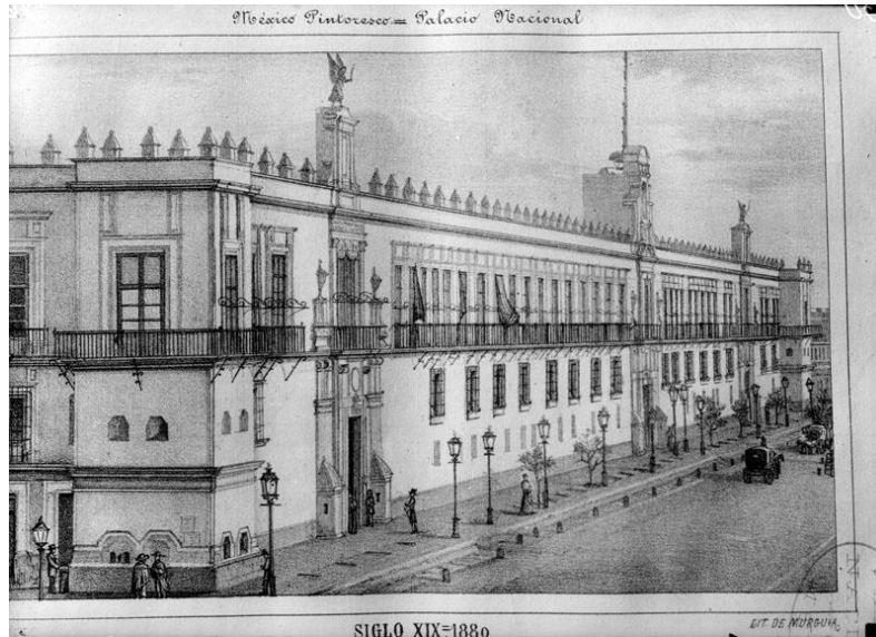
3) México Pintoresco, Palacio Nacional , Núm. de inventario 58