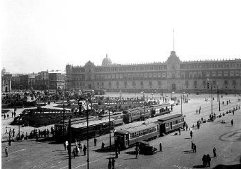
15) Palacio Nacional, vista parcial , Núm. de inventario 201441, Archivo Casasola, Fototeca Nacional del INAH. Imagen tomada del sitio de la Fototeca Nacional del INAH: http://www.fototeca.inah.gob.mx/fototeca/ (Fecha de actualización: 24 de noviembre de 2015)