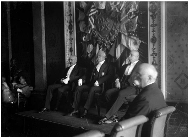
4) Porfirio Díaz acompañado de Ramón Corral y Enrique Creel durante ceremonia de condecoración en el salón Panamericano de Palacio Nacional , Núm. de inventario 8312, Archivo Casasola, Fototeca Nacional del INAH. Imagen tomada del sitio de la Fototeca Nacional del INAH: http://www.fototeca.inah.gob.mx/fototeca/ (Fecha de actualización: 24 de noviembre de 2015)