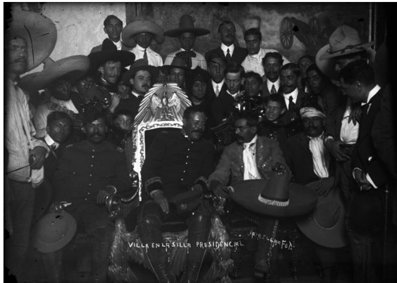
12) Francisco “Villa en la silla presidencial”, acompañado por Emiliano Zapata , Núm. de inventario 288109, Archivo Casasola, Fototeca Nacional del INAH. Imagen tomada del sitio de la Fototeca Nacional del INAH: http://www.fototeca.inah.gob.mx/fototeca/ (Fecha de actualización: 24 de noviembre de 2015)