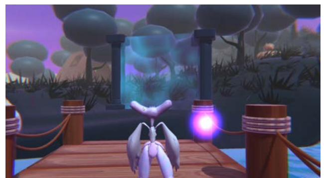
Figura 8. Primera Isla 2.0

Se buscó darle una mejoría a la parte visual, ocupando Post-Processing, que nos permitió tener un juego visualmente más estético. Igual se trabajó en la simulación de lo que se haría dentro de las islas como actividades que permitan a los usuarios cambiar la perspectiva negativa que se tiene del duelo.