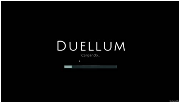
Figura 9. Pantalla de carga

Se desarrolló la Isla de Negación más a fondo para dar a entender, igual se trabajó en los diálogos de inicio y final de cada isla, para dar un contexto de lo que se haría en estas. Igualmente se trabajó en la optimización del juego, con pantallas de carga asíncronas, para que le diera tiempo a la computadora de cargar todo sin atorarse, y también con Occlusion culling (proceso para renderizar los game objects visibles por la cámara) del juego, que solamente cargue ciertos objetos, se mejoró de manera significativa la optimización.