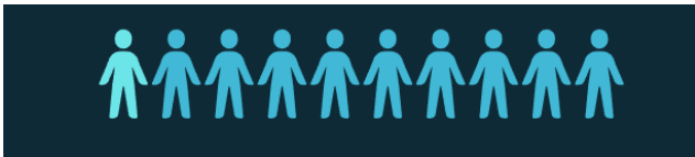
Figura 1. Gráfico de dolientes.

más clara de lo que puede hacer una sola pérdida, porque como dice Villagómez Zavala et al. (2020) “De acuerdo con varios estudios realizados sobre el duelo por la pérdida de un ser querido, Luna (2017) menciona que cada fallecimiento puede afectar en promedio hasta diez personas y se calcula que alrededor del 10% de los dolientes atravesará por un duelo complicado con implicaciones severas para su salud física y psicológica.”