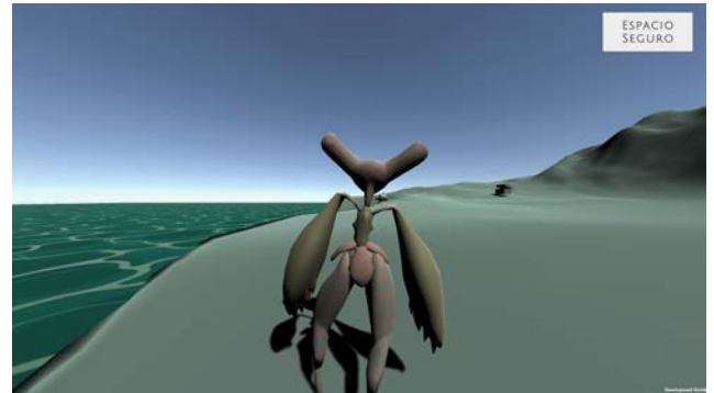
Figura 7. Primera Isla

A pesar de los errores encontrados en este prototipo, hubo buena retroalimentación hablando de la introducción y el contexto del mismo.