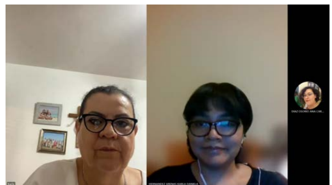
Figura 2. Entrevista con tanatóloga experta..

Sin embargo, también cabe resaltar la existencia de otros modelos que han proporcionado otras perspectivas hacia el duelo, por ejemplo las cuatro fases del duelo de Bowlby y Parkes, las cuatro tareas del duelo de William Worden, acercamiento del duelo de Wolfelt y el modelo narrativo y constructivista de Niemeyers, dichas teorías y modelos explican cómo se puede sobrellevar una pérdida y cómo puede una persona seguir adelante con su vida. Sin embargo era necesario saber si es que alguno de estos modelos es el ideal.