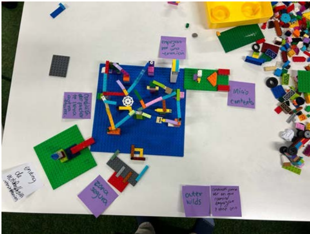
Figura 5. Actividad de co-creación

Este prototipo sirvió de base para el tema, en una actividad de co-creación con distintos compañeros, se replanteó la idea inicial, con una historia y una mecánica que estuviera más apegada a los principios de diseño.