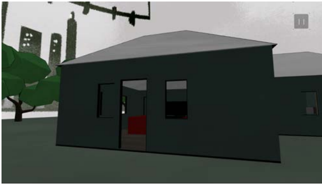
Figura 4. Primer prototipo creado para VR

Este prototipo sirvió de base para el tema, en una actividad de co-creación con distintos compañeros, se replanteó la idea inicial, con una historia y una mecánica que estuviera más apegada a los principios de diseño.