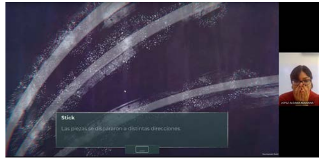
Figura 13. Prototipo de alta fidelidad prueba.

El usuario desde un principio tenía mucha actitud para realizar la prueba, se le notó bastante emocionado. Continuó de esa manera durante toda la prueba y expresó bastante durante esta misma. Empezó familiarizándose poco a poco con los controles, a veces se confundía con algunos pero iba agarrando confianza y entendiendo mejor con el tiempo. Describía lo que hizo durante el tutorial y se pudo notar que estaban bien los tiempos. Durante la novela gráfica iba leyendo detalladamente y haciendo comentarios como “ayyy que bonito”, “esto es muy cierto”, “no puede ser”, todos estos comentarios son una buena retroalimentación de que hay elementos bastante importantes en la narrativa.