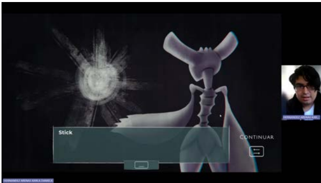
Figura 12. Prototipo de media fidelidad prueba.

El usuario inició el juego con un tutorial que fue creado con pequeñas animaciones, los tiempos fueron adecuados por lo que no hubieron inconvenientes al recordar los movimientos principales. Después de eso, se adentró a la introducción narrativa del juego donde sintió que esta parte era muy larga y tardada. Sin embargo, el objetivo principal fue entendido y comentó que simpatizó con el personaje, le agradó el aspecto visual de la experiencia sin embargo hubo un momento donde no comprendió qué hacer porque antes de adentrarse a la isla, lo ideal es hablar con un habitante de la misma para aprender del mundo.