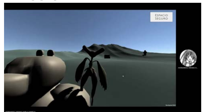
Figura 11. prototipo de media fidelidad prueba.

La primera persona en probar el juego logró comprender la relación de la historia con el tema del Duelo porque funcionó incluir un video que explica el contexto del personaje y el mundo en el que se adentraría, a pesar de que el video para el prototipo iba un poco rápido, se entendió la tarea principal que es la de recolectar los trozos de corazón y usar un bote de papel para moverse de isla a isla.