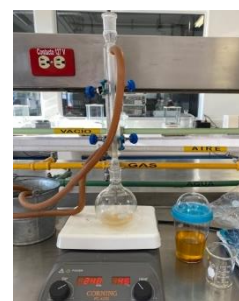
Fig. 2: Proceso de saponificación de aceite de cocina usado durante calentamiento en sistema de reflujo. Elaboración propia (2023).

Cuando se completó la disolución, se dejó enfriar y agregar 10 ml de etanol. Se agitó la mezcla y transvasó a un matraz redondo, sostenido sobre la parrilla con unas pinzas para soporte. En otro vaso de precipitado de 100 ml se pesó 5 g de aceite de cocina usado. Se calentó sobre la parrilla para fundir la grasa y poder trasvasarla al matraz redondo que contiene el hidróxido de sodio.