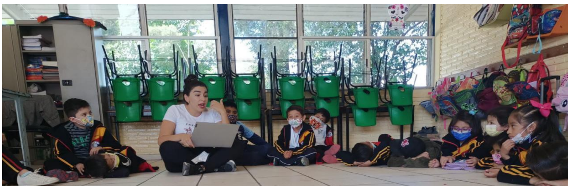
Ilustración 11. Lectura de cuento "Chispa Brava"

Interacción: Se mostraron participativos y atentos, les agradó la historia, esta clase se interrumpió por la clase de educación física, por lo cual se tuvo que retomar al día siguiente, habían perdido un poco la atención que se había logrado en un primero momento, sin embargo, fluyo de manera que les permitió llegar a las conclusiones esperadas. Las cuales fueron: no hacer caso cuando me quieren hacer enfadar, si hace daño no lo hago, mis emociones son importantes, pero debo saber controlarlas.