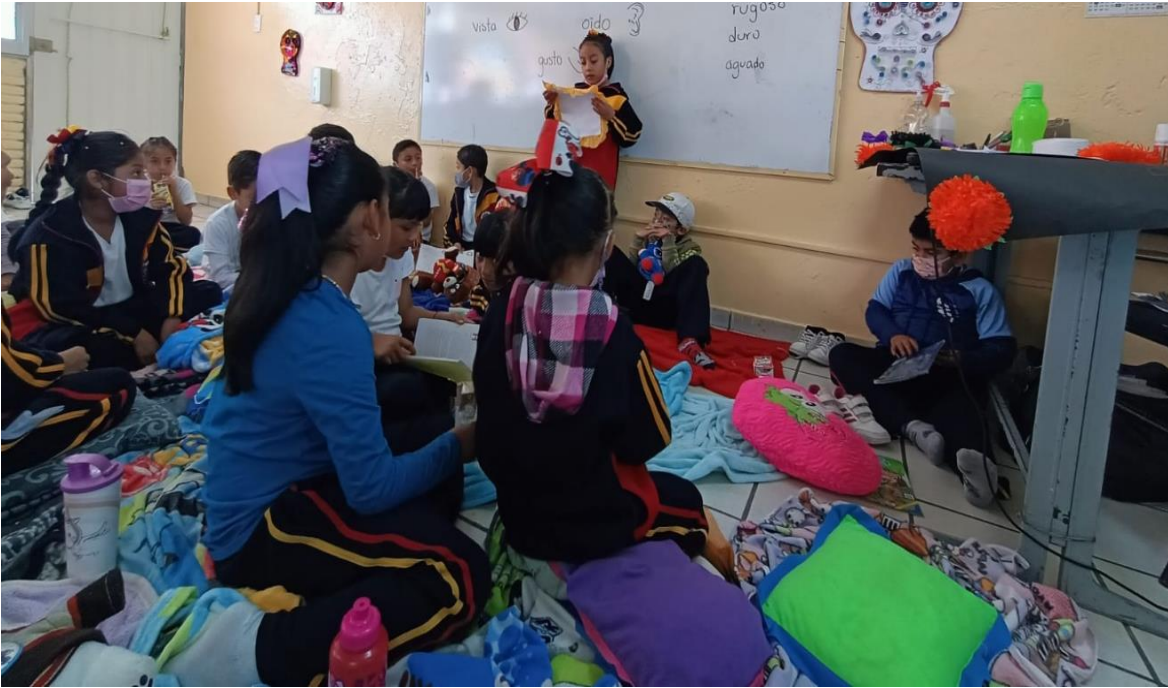
Ilustración 7. Jugando "En los zapatos de otros"