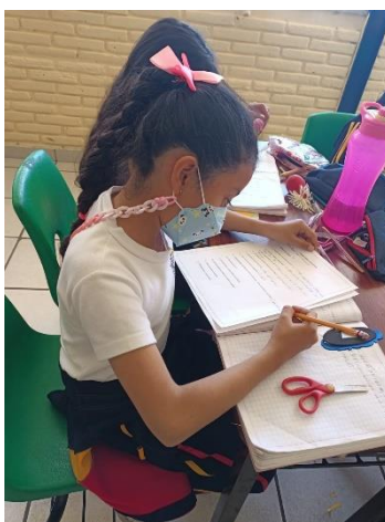
Ilustración 3. Alumna respondiendo entrevista.

Indican que les gustan las actividades en donde hay juegos, o en las que salen al patio, les agrada cuando conviven en el salón o cuando hay algún festejo, hay diversidad en lo que les pone triste mencionan que cuando regañan a sus compañeros, cuando sus papás se enojan, cuando un amigo se enoja con ellos y lo que les pone enojados es cuando no obtienen los resultados que deseaban o que se burlen de ellos. (Ver ilustración 3)