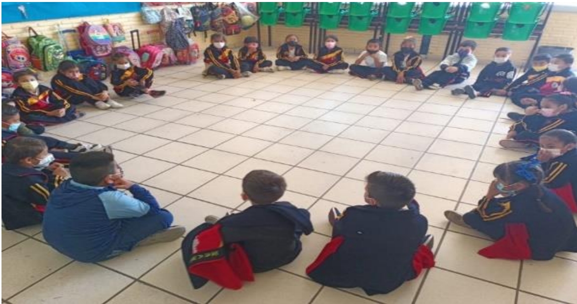
Ilustración 8. Escuchan la narración sobre situación planteada y externan opiniones.