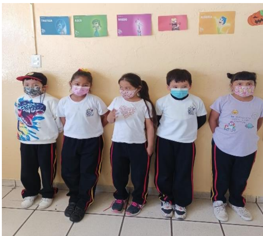
Ilustración 4. Narración de experiencias que le hayan generado la emoción que eligieron.

Interacción: En esta sesión los estudiantes se mostraron activos, expresaron situaciones donde sintieron la sensación que sus compañeros comentaron, se sintieron comprendidos, la actividad que más les agradó fue realizar globos de harina para mostrar sus emociones, además mencionaron que les agradó sentir los globos, sobre todo cuando los aplastaban, pues les generaba tranquilidad, varios hicieron no solo un globo, sino el de todas las emociones, pues decían que han experimentado todas. Comenzaron a sentir empatía por las situaciones que han pasado sus compañeros, sin asignarle nombre como tal, sin embargo, denotan interés.