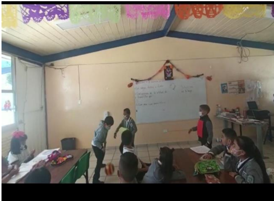
Ilustración 10. Representación de alumnos, diversas situaciones.