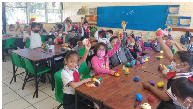
Ilustración 1. Grupo de trabajo

Las características de estos sujetos son peculiares, cada uno responde a necesidades y procesos diferentes que los hacen únicos y especiales; no obstante, la mayoría de ellos muestran ausencia de padres por situaciones laborales, por tanto, se encuentran con abuelos o están demasiado tiempo en medios digitales; por lo cual, se buscó plantear actividades y en conjunto estrategias que favorecieran el desarrollo de competencias emocionales.