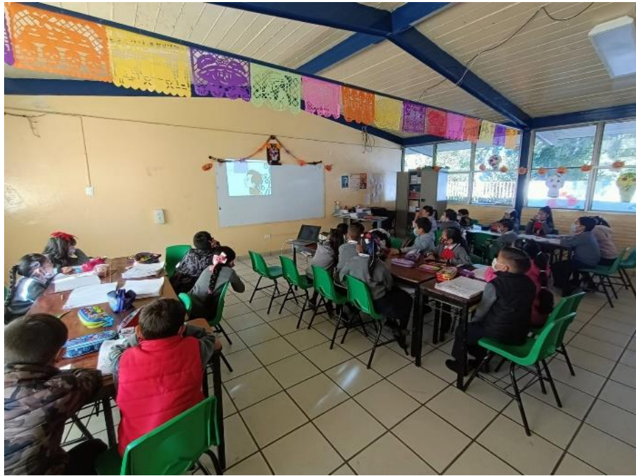
Ilustración 9. Se muestra video “Aprender a vivir sin violencia”