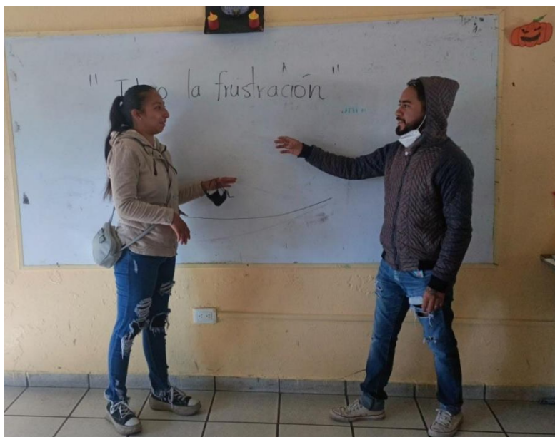
Ilustración 12. Escenificación de padres, momentos de frustración.

Actividades: Consiste iniciar el día, saludando por lo menos a diez de sus compañeros con alguna parte de su cuerpo, hablándole por su nombre. Comienzan viendo un video titulado “Tolerancia a la Frustración” sobre dos niños que juegan y uno de ellos siempre se enfada cuando va perdiendo o los resultados no son como él planea, responden ¿Qué piensan sobre las actitudes de los personajes? ¿Qué sienten cuando las cosas no salen como ellos quieren? ¿Qué aprendieron del video? Previamente se preparan letreros de las emociones para cada uno de los alumnos, además, se solicita la presencia de algunos de sus padres, que escenificaran cuatro situaciones en donde ellos han sentido frustración y su forma de resolverlo, (Véase ilustración 12) los alumnos alzan los letreros para opinar sobre la emoción que los personajes sintieron y comentan sobre cómo ellos creen que deben reaccionar. Para finalizar observan la frase en el pizarrón “Las cosas no siempre salen como uno quiere” y escriben en su libreta algunas sugerencias para tolerar la frustración con base en un video que observaron y realizan un dibujo.