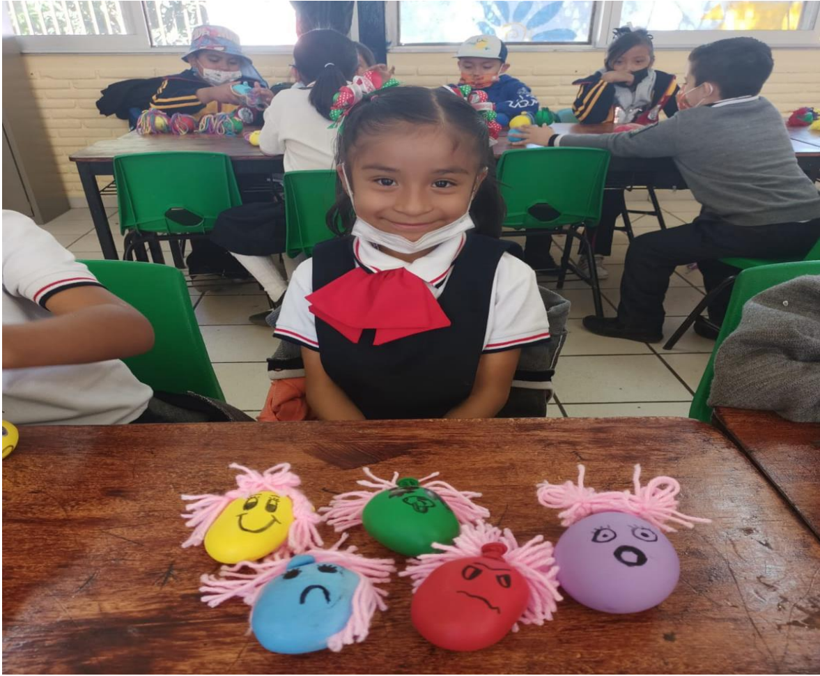
Ilustración 5. Se muestra muñecos de las emociones.