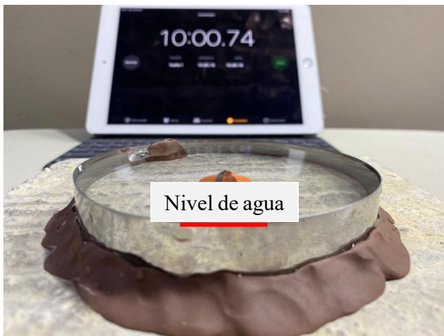
Figura 2. Prueba de permeabilidad en placa de concreto. La imagen nos muestra el término de la prueba en la que podemos observar que el nivel del agua se mantuvo hasta el tope del cono.

La mezcla de 850 ml de nejayote, 60 gr de mucílago de nopal, 50 gr de alumbre y 40 gr de jabón se aplicó sobre una placa de concreto misma que se sometió a una prueba de permeabilidad como se muestra en la figura 1.