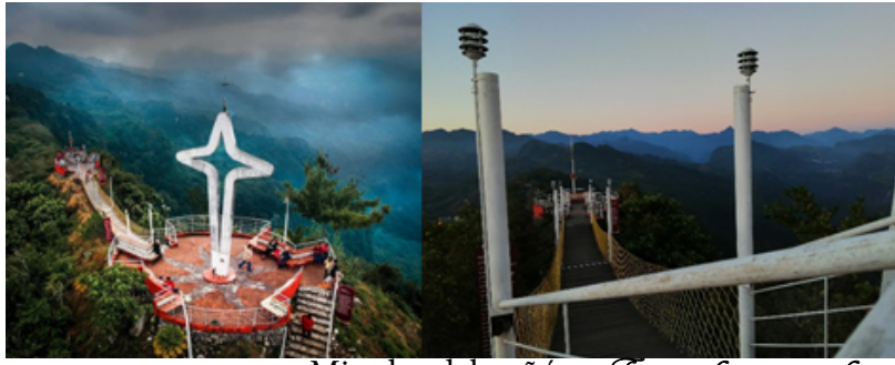
Mirador del peñón