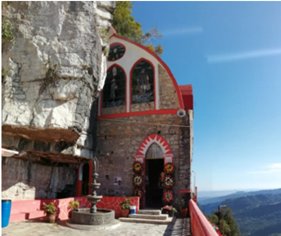
Santuario de la virgen del peñón