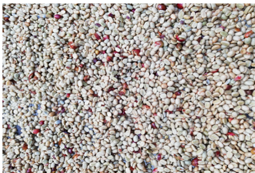
Café despulpado

Mi papá me ha dicho tres cosas importantes que debe tener un buen café: acidez, cuerpo y aroma. Sin embargo, conseguir tales características no es tan sencillo, su proceso lleva tiempo y mucho esfuerzo. Mujeres y hombres, con una canasta colgada a la cintura, empiezan la jornada cuando sale el sol, cortando de las matas el café cereza rojo, para después llevar los costales llenos de café para su beneficio, con bestia o si se tiene suerte en una camioneta. Un quintal de café cereza equivale a 245 kilos, en el proceso de beneficio se despulpa, es decir, se separa la pulpa del grano, para continuar con el proceso de prima lavado; donde se deja fermentar por 24 horas, para después ser lavado con agua y quitarle el mucílago, el cual es una capa viscosa que recubre la semilla. Una vez lavado y escurrido el café ahora debe pesar 120 kilos y se pone en planilla a orear, y de este proceso se obtienen 100 kilos, posteriormente el café es secado, al igual puede ser en planilla o en secadora y se obtienen 57 kilos y medio de café pergamino, el productor lo puede vender así o tostarlo y molerlo para obtener finalmente 38 kilos de café en polvo.