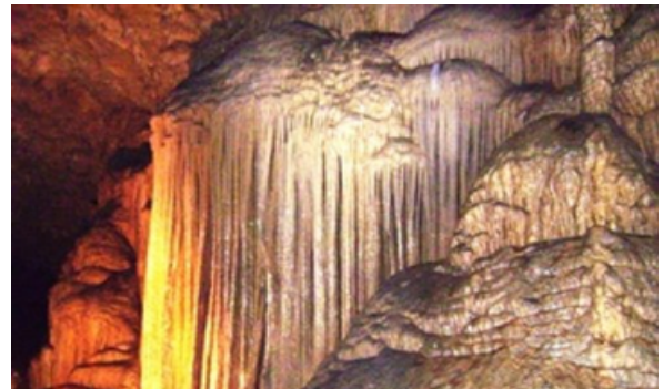
Grutas de Tepetitlan.

Si deseas viajar a conocer el pueblo de Jonotla desde la capital poblana la distancia es de 190 km. En automóvil desde Puebla, tomar la carretera Puebla-Orizaba hasta Amozoc, luego tomar la 140D rumbo a Perote. Tomar la 129D hacia Teziutlán, tomar a salida a Zaragoza y Cuetzalan. Tomar la 575 rumbo a Zacapoaxtla y pasando Zacapoaxtla seguir por la 575 rumbo a Cuetzalan hasta donde la carretera se bifurca. Tomar hacia la izquierda y en 15 minutos se llega a Jonotla.