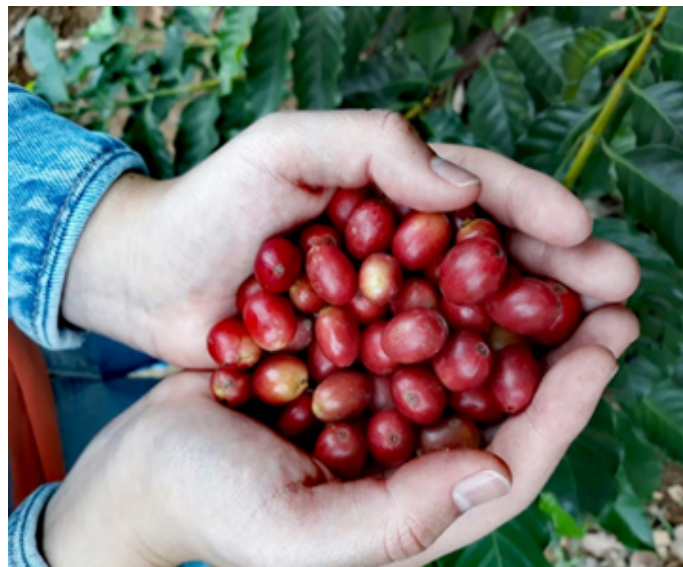
Café cereza