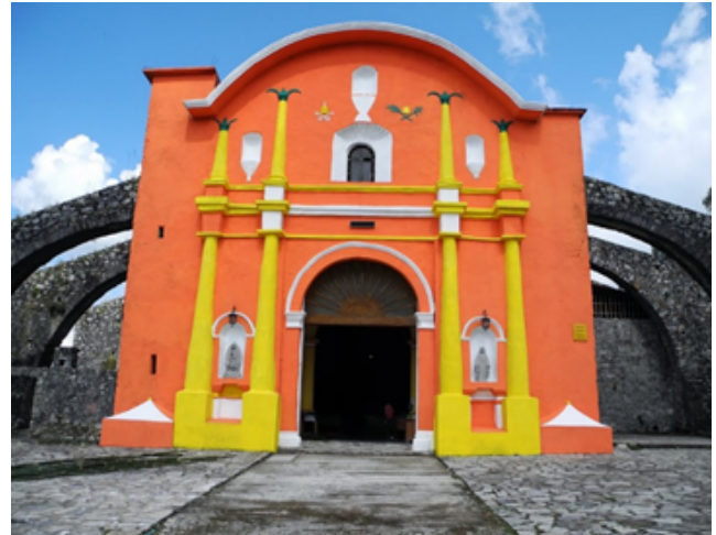
Iglesia de San Juan Bautista