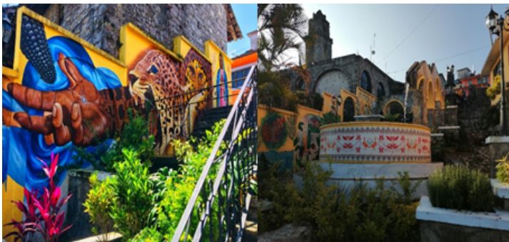
Callejón del beso