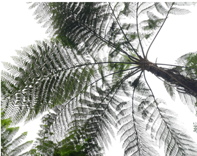
Helecho arborescente

Son plantas muy típicas del ecosistema de bosque de niebla, sin embargo por su uso indiscriminado y comercialización se encuentran en peligro de extinción. Los helechos forman troncos altos, con coronas de frondas, estos no cuentan con flores o frutos, se reproducen mediante soros, que generan esporas en lugar de semillas.