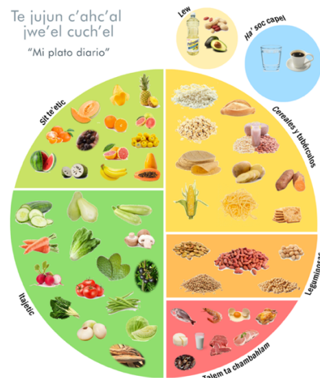
Figura 1. Herramienta gráfica “Mi Plato Diario”

La participación de los integrantes en general fue satisfactoria, las mayores dificultades fueron el idioma, los distractores (niños) y en algunos, la falta de interés. Sin embargo, se consiguió el objetivo, se desarrollaron y aplicaron los talleres de acuerdo a lo planeado.