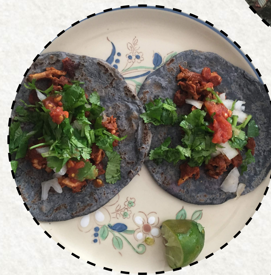
LA VIDA ES MEJOR DONDE HAY MAÍZ AZUL.