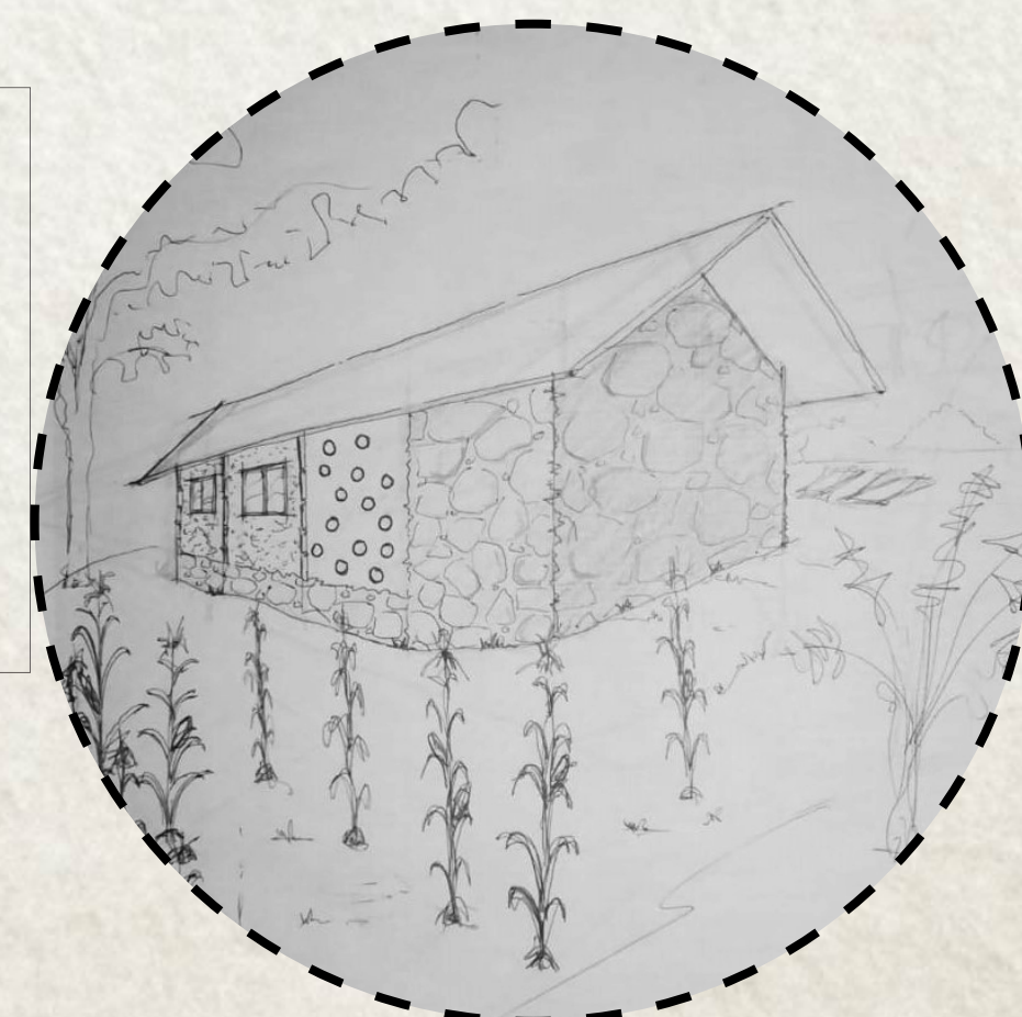
VISTA EXTERIOR DEL LABORATORIO