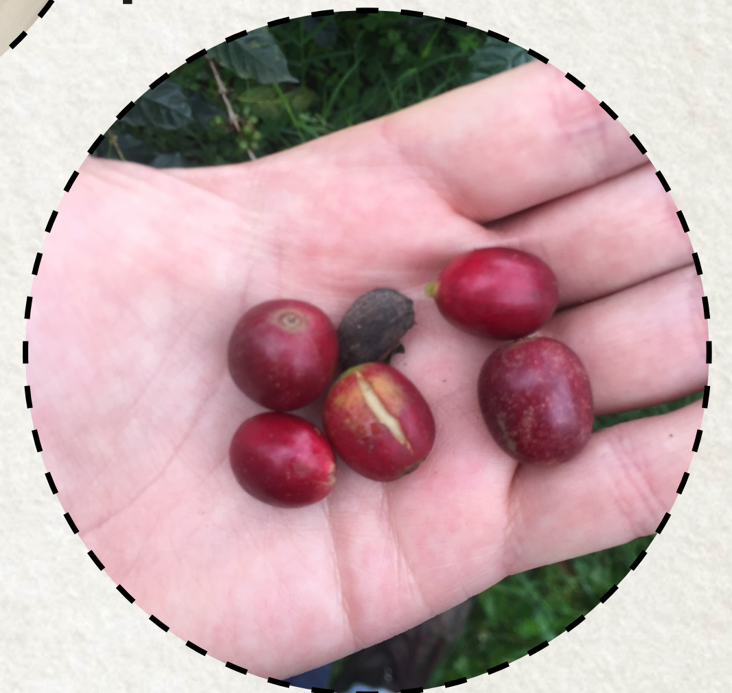
UNO DE LOS CULTIVOS MÁS IMPORTANTES DE LA ZONA ES EL CAFÉ