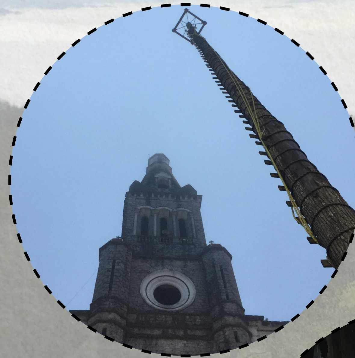
PARROQUIA DE SAN FRANCISCO DE ASIS EN CUETZALAN.

Proyectos como Tetsijsilin nos demuestran que existen otros tipos de desarrollo, que no todo debe apuntar al desarrollo industrial y que el campo tiene tanto valor como la ciudad o incluso más.