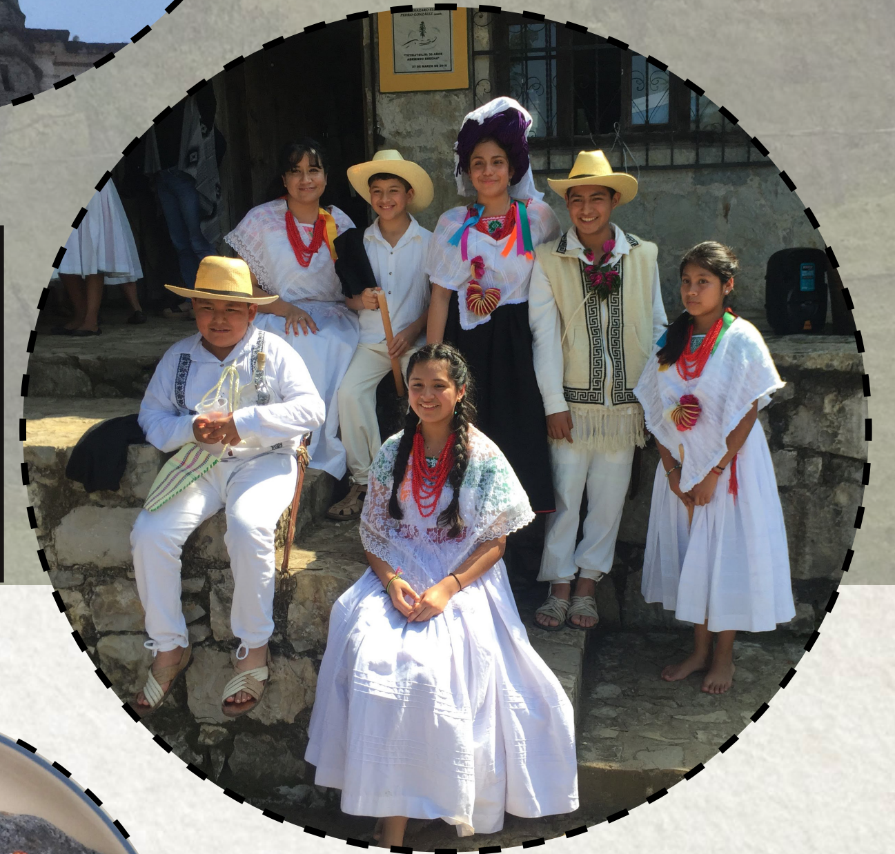
RECREACIÓN DE UNA BODA TÍPICA DE LA SIERRA NORTE