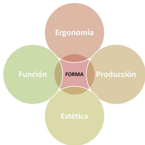
Esquema de factores para el desarrollo de proyectos de diseño industrial utilizados en el CIDI UNAM

Como se mencionó, estos factores permiten dar forma a los objetos sabiendo que no son los únicos a tomar en cuenta, pero dentro de estos pueden englobarse otros como los aspectos de comunicación, de comercialización, entre otros, siempre considerando el entorno en el que se dará la interacción entre el usuario y el objeto al realizar la actividad.