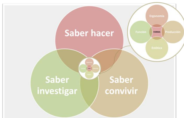
Modelo propuesto para la consideración de valores como parte del desarrollo de proyectos de diseño industrial.

Los proyectos desarrollados cubrían en gran medida las características necesarias para poder competir, lo que se logró con un enfoque incipiente del modelo que aquí se presenta y con el nivel de alcance que el nivel académico en el que se encuentra la asignatura permitía (segundo semestre).