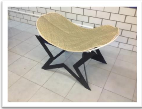
Modelo de banco elaborado por la alumna Mildred Figueroa Carrera.

A continuación se presentan dos trabajos resultantes de esta asignatura.