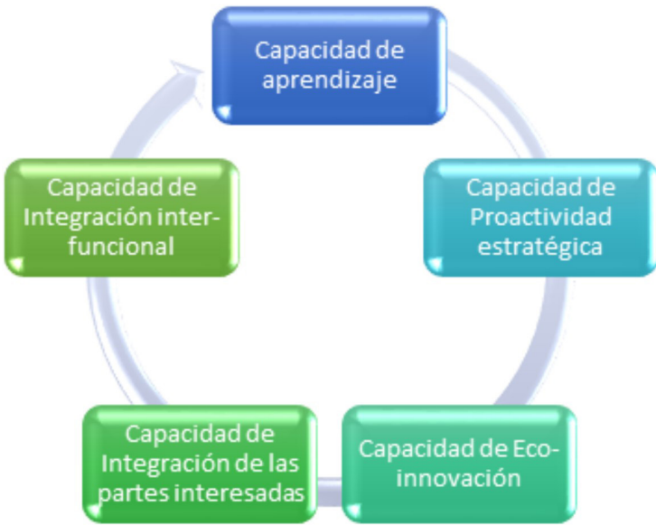
Figura 2. Capacidades organizacionales fundamentales para integrar la capacidad dinámica de proactividad ambiental