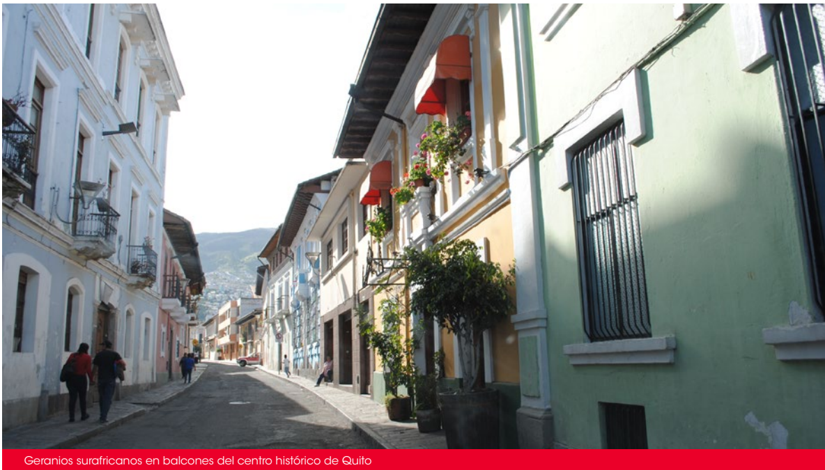
Geranios surafricanos en balcones del centro histórico de Quito

la ciudad. La pervivencia de la colonialidad en la forma de construir el territorio se aprecia, por ejemplo, en la más o menos reciente “tradicción” de adornar los balcones de la ciudad con geranios surafricanos ( Pelargonium spp.). Esta acción ha llevado incluso a que se declarara a Quito “Ciudad de los Geranios” (Concejo Metropolitano, 2013a), sin notar que la gran mayoría de aquellos exhibidos en los balcones son especies exóticas y casi no aparece el geranio nativo Geranium chilloense . Contrasta esto con las ordenanzas que apuntan a fomentar las plantas nativas de la ciudad como la orquídea maywa de Quito, o la salvia de Quito (Concejo Metropolitano, 2013b). Esta construcción de identidad, a partir de una especie introducida de Suráfrica, ilustra la poca sapiencia de los quiteños sobre su flora, aunque ha sido interesante que, tras entregar el informe extenso sobre esta investigación al IMP, su directora compareciera públicamente explicando el asunto de los geranios introducidos, y recientemente se han promovido celebraciones alrededor del taxo ( Passiflora tripartita ), declarada flor de la ciudad en 2010. A veces solamente se trata de compartir las ideas.