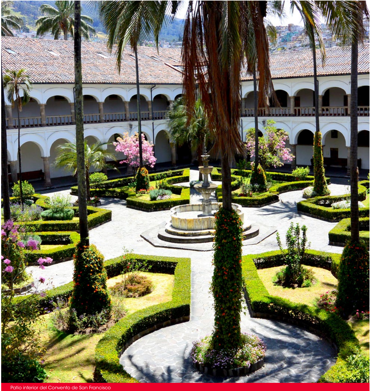
Patio interior del Convento de San Francisco