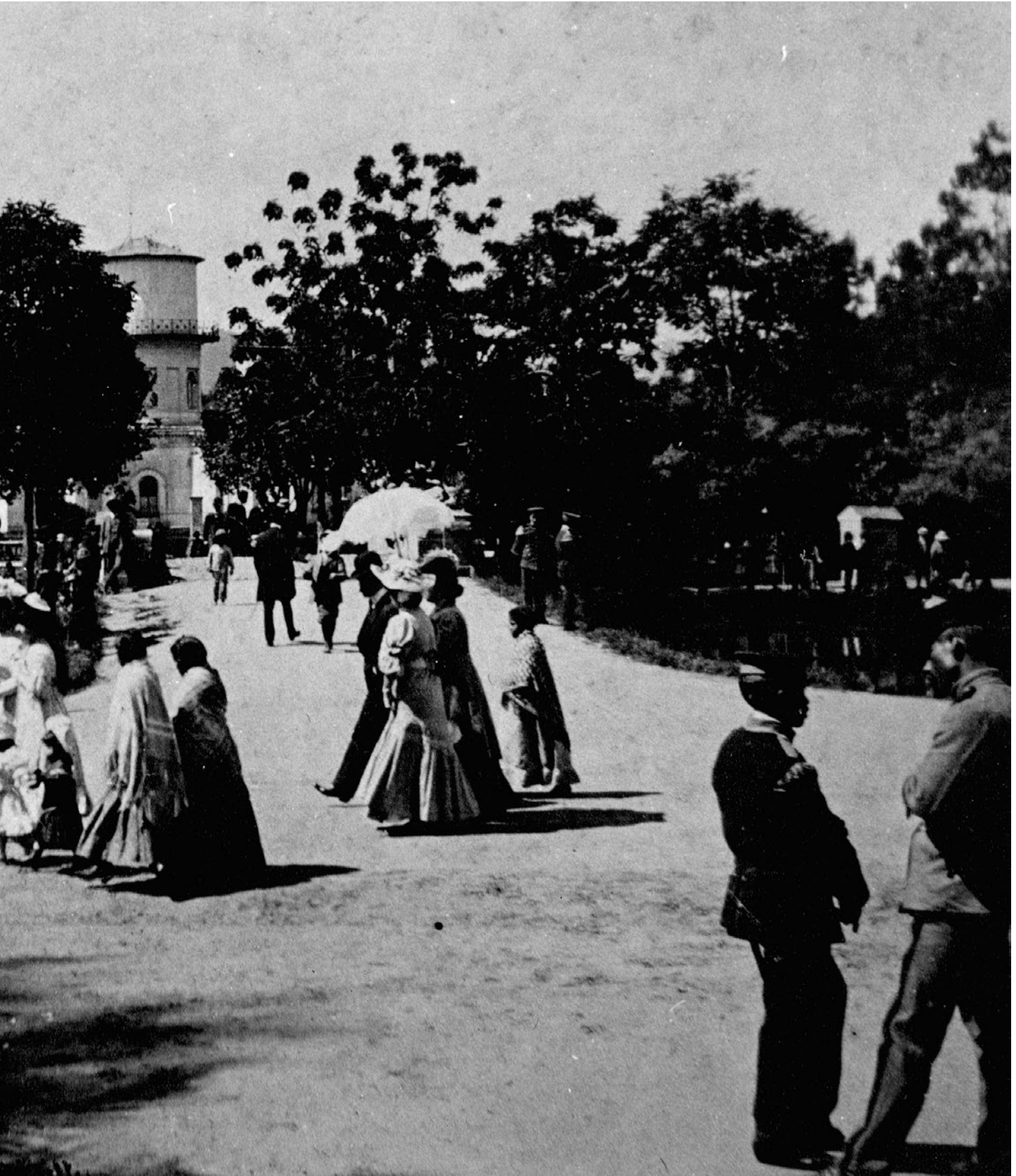
FIGURA 1. Paseantes en La Alameda, c. 1900.