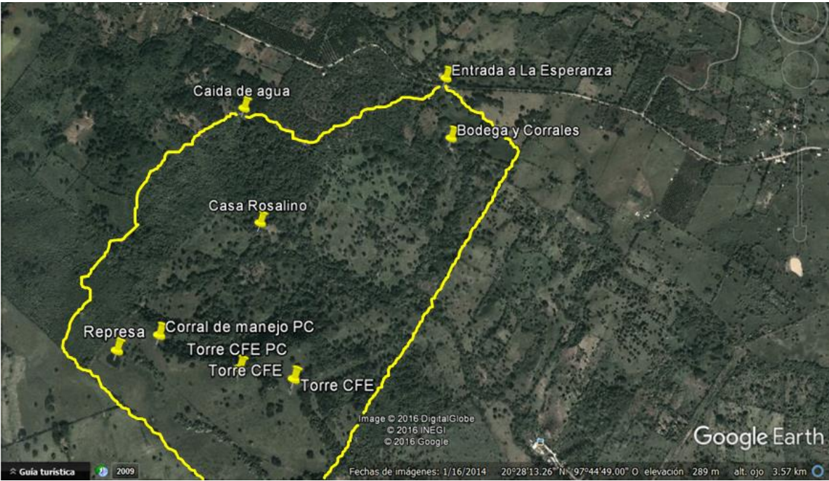
Imagen 3. Extensión

La extensión del rancho es de doscientas hectáreas y un inventario de trescientas cincuenta cabezas de ganado aproximadamente.