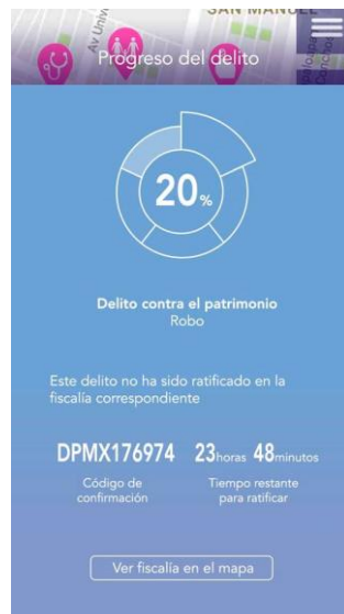
Pantalla de proceso de denuncia de prototipo de alta fidelidad

Este prototipo se hizo utilizando la herramienta JustInMind Prototyper, que proporciona herramientas para que el usuario