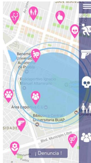
Pantalla de página principal de prototipo de alta fidelidad