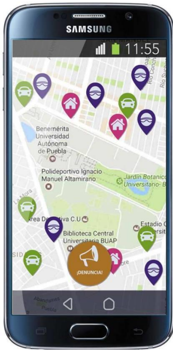
Pantalla de página principal de prototipo de fidelidad media

En esta versión, el usuario comprendió cómo iniciar el proceso de denuncia, sin embargo, no lo entendió como un proceso que va más allá de presionar el botón para denunciar. Logró conocer que existía la posibilidad de interactuar con otros, pero el resto de los objetivos no se cumplieron por tres factores importantes. El primero fue el estilo visual, que no era armónico y se sentía pesado. El segundo estuvo ligado a cuestiones semióticas, porque los íconos no representaban lo que se pretendía para el usuario. El tercero fue la arquitectura de información, que no estaba estructurada para que los usuarios entendieran las tareas como procesos.