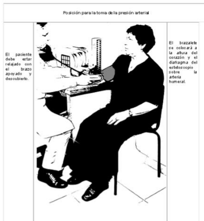
Figura 1. Toma correcta de TA