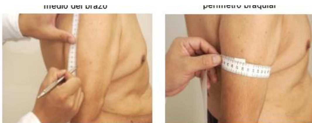
Figura 3. Medición circunferencia braquial

Ayudar a la persona adulta mayor, se ubique en posición erguida, con los hombros relajados, brazos en ambos lados del cuerpo y el codo derecho flexionado en un ángulo de 90°. Ubicarse detrás de la persona, del lado donde se va realizar la medición. Con la cinta métrica marcar con un plumón (marcador antropométrico) el punto medio de la distancia entre el extremo del hombro (punta del acromion) y la punta del codo (punta del olécranon). Marcar el punto medio en la cara anterior del brazo. Ubicado el punto medio del brazo, extender el brazo a lo largo del cuerpo y en forma paralela al tronco; para medir el perímetro braquial sobre el punto medio ya marcado (ver figura 3). Leer la medida en centímetros con una aproximación de 0.1 cm, y registrar en la historia clínica (32).