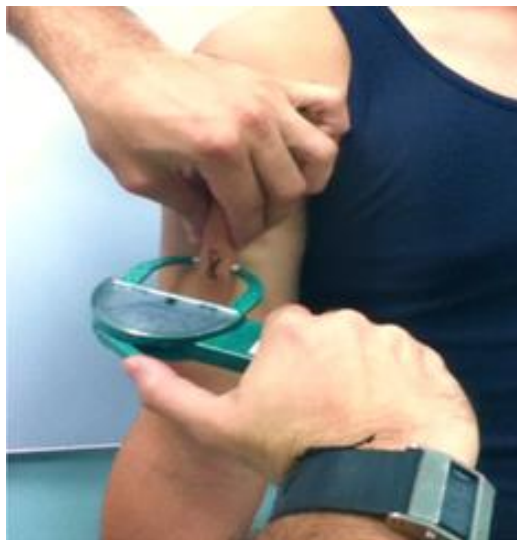
Figura 5. Panículo adiposo bicipital

El pliegue cutáneo bicipital es un pliegue vertical en el aspecto anterior del brazo, sobre el punto medio del músculo bíceps, directamente opuesto al sitio de pliegue tricipital. Ubique al sujeto de pie con el brazo relajado colgando a lo largo del cuerpo, sitúese al frente y ligeramente a la derecha, tome el panículo en dirección al eje longitudinal del brazo y efectúe la medición, reportándola en milímetros y la fracción más pequeña que permita el aparato (ver figura 5) (32).